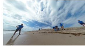
PSNR : 44.2

(3)의 수식을 이용해 품질을 평가하게 되면 관심 맵의 영역에 따라 같은 픽셀 차이라도 최대 (1+t)배까지 픽셀 간의 차이값에 대해 벌점을 줄 수 있게 된다. 결과적으로 사용자가 관심 맵의 중요도가 높은 곳을 저화질로 영상을 보고 있을 경우, 중요도가 낮은 곳을 저화질로 보고 있는 경우보다 민감하게 평가할 수 있으며, 각 타일의 품질을 결정할 때 (3)의 지표를 이용하여 사용자 경험에 알맞은 품질 할당을 시도할 수 있다.