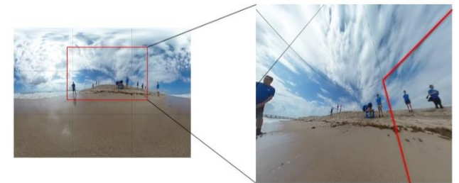
그림 3. 타일 영역 구분에 따른 비균등 품질 영역 감상

앞서 서술한 것처럼 MCTS 기법을 이용해 다양한 품질로 인코딩된 타일들에 대해 360 영상을 만들고, 시선 정보를 이용하여 사용자 시점 영상을 렌더링한다.