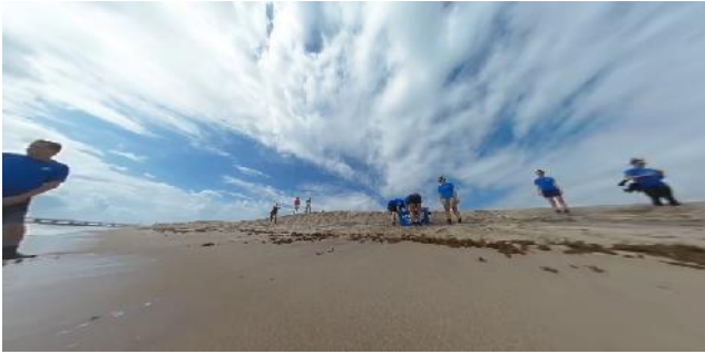
그림 4. 사용자 시점 영상의 예

영상의 관심 맵을 도출하여 관심 맵 영역에 가중치를 평가하는 방법을 제안한다.