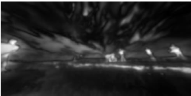
그림 5. 그림 4의 관심 맵(Saliency map) 도출 결과

해당 방법을 통하여 계산된 관심 맵은 객체 또는 이미지 정보가 복잡한 영역을 잘 검출해낼 수 있다. 해당 관심 맵 정보를 이용하여 두드러지는 영역의 픽셀에 대해 품질 계산 시 추가적인 가중치를 주면 사용자 시점의 경험에 중요한 부분을 상대적으로 보존하며 평가할 수 있게 된다. PSNR 평가식은 다음과 같은 수식을 통하여 계산된다.