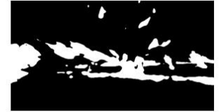
SPSNR(t = 10) : 38.7

기존의 비균등 품질 사용자 시점 영상에서 원본의 사용자 시점 영상과 비교했을 때에 타일 영역에 작다면 품질 평가의 값이 높게 출력되어 사용자 경험 평가에 크게 도움을 주지 못한다. 본 논문에서 제안하는 방법을 사용하여 관심 영역의 픽셀 차이에 대한 가중치를 더하게 되면 사용자 시점 영상에서 저화질의 타일에 두드러진 영역이 포함될수록 품질 평가가 낮게 측정된다.